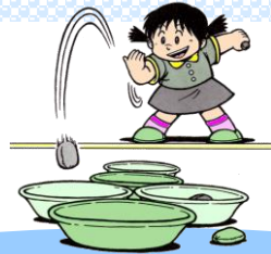
[せんめんき おてだまなげ]