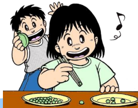
[まめつまみ さらうつし]