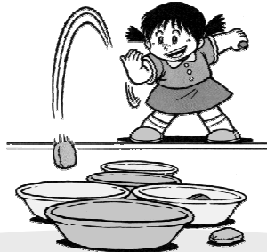
[せんめんき おてだまなげ]