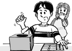
[てんとりぴんぽん]