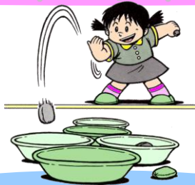
[せんめんき おてだまなげ]